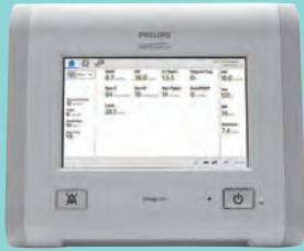
トリロジー Evoシリーズ