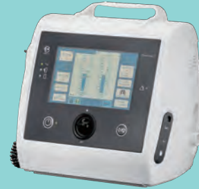
クリアウェイ 2 MI-E